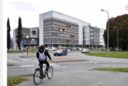
Satakunnan ammattikorkeakoulun opiskelijat näin puolet tulee maakunnan ulkopuolelta ja vähemmistö 60 prosentilla jättä Satakuntaan. Viiri toimitus.